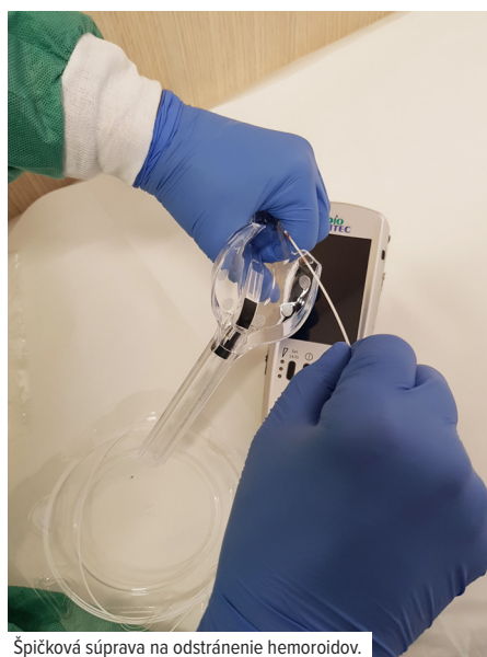
Špičková súprava na odstránenie hemoroidov.

- To je práve zrada! Ľudia si myslia, že hemoroidy nájde lekár aj pri kolonoskopickom vyšetrení, ale to nie je pravda. Na kolonoskopii sa dajú objaviť len vnútorné hemoroidy, pretože kolonoskop zobrazuje prostredie až od 5 centimetrov ďalej a oblasť konečníka technicky nezachytí, lebo na to nie je usposobený. Pri rektoskopii vidíme od nula do dvadsať centimetrov. Preto