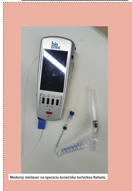
Moderný minilaser na operáciu konečníka technikou Rafaelo.