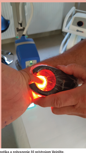
Diagnostika a zobrazenie žíl prístrojom Veinlite.