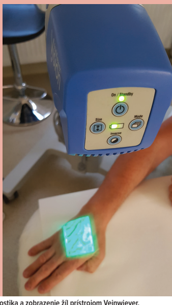
Diagnostika a zobrazenie žíl prístrojom Veinviewer.